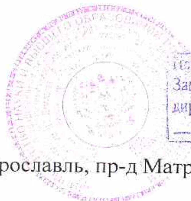
Анатолий Викторович Карпов